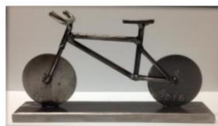
Figuur 1: trofee clubkampioenschap 2016